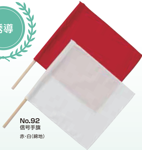
No.92 信号手旗 赤・白(綿地)