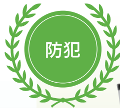
No.138 刺股 2段式 サイズ 収納時 1220mm 伸張時 2015mm 径 31mm