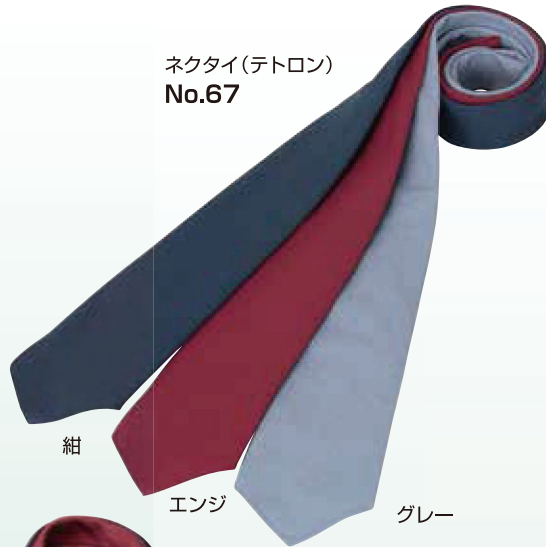
ネクタイ(テトロン) No.67