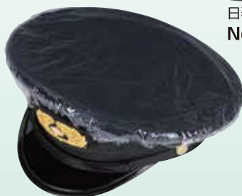
雨覆(透明ビニール) No.51-1