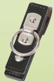
No.74 警棒吊 皮製 黒