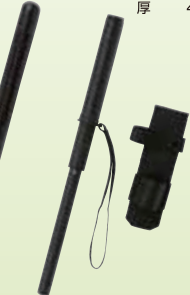
No.133 特殊警棒 ケース付 サイズ 縦長 235mm 伸長 405mm 重量 200g