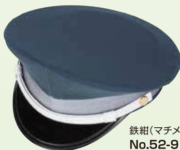
鉄紺(マチメッシュ) No.52-9