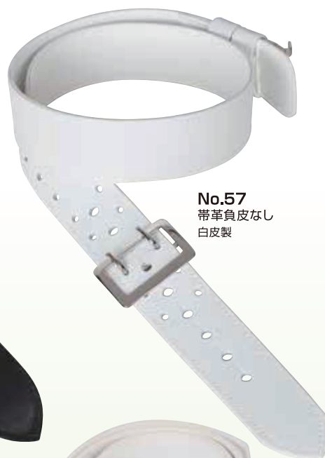
No.57 帯革負皮なし 白皮製