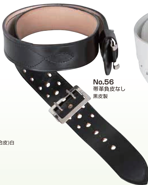
No.56 帯革負皮なし 黒皮製