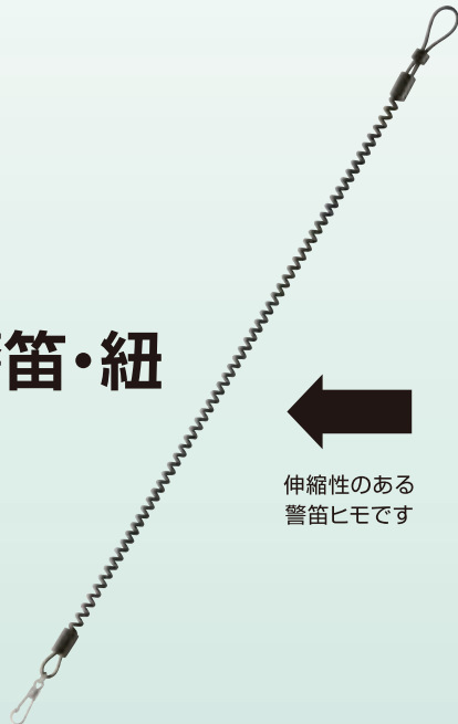
伸縮性のある 警笛ヒモです