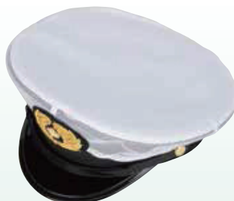
日覆(マチメッシュ) No.50-2