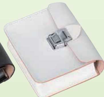
No.79-3 No.79-4 小物入れ(大)