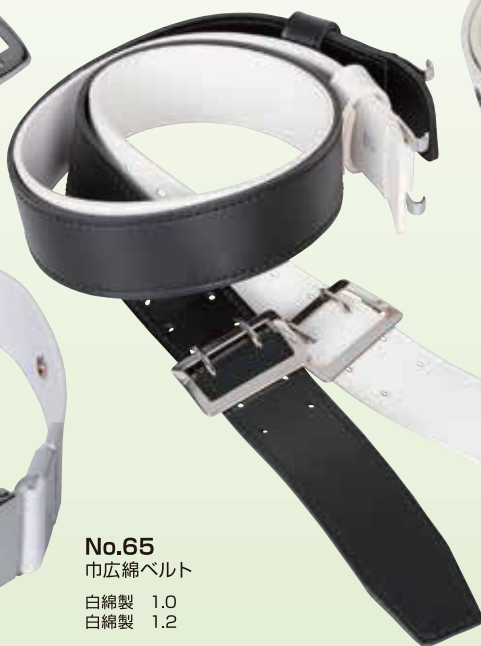
No.65 巾広綿ベルト 白綿製 1.0 白綿製 1.2