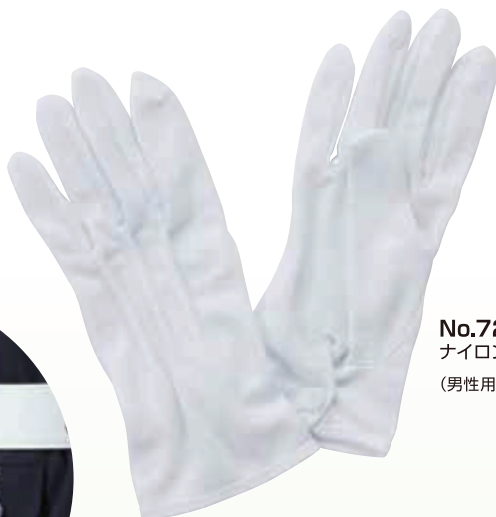
No.72-1 ナイロン手袋 (男性用)