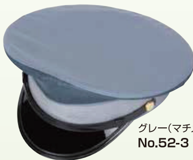
グレー(マチメッシュ) No.52-3