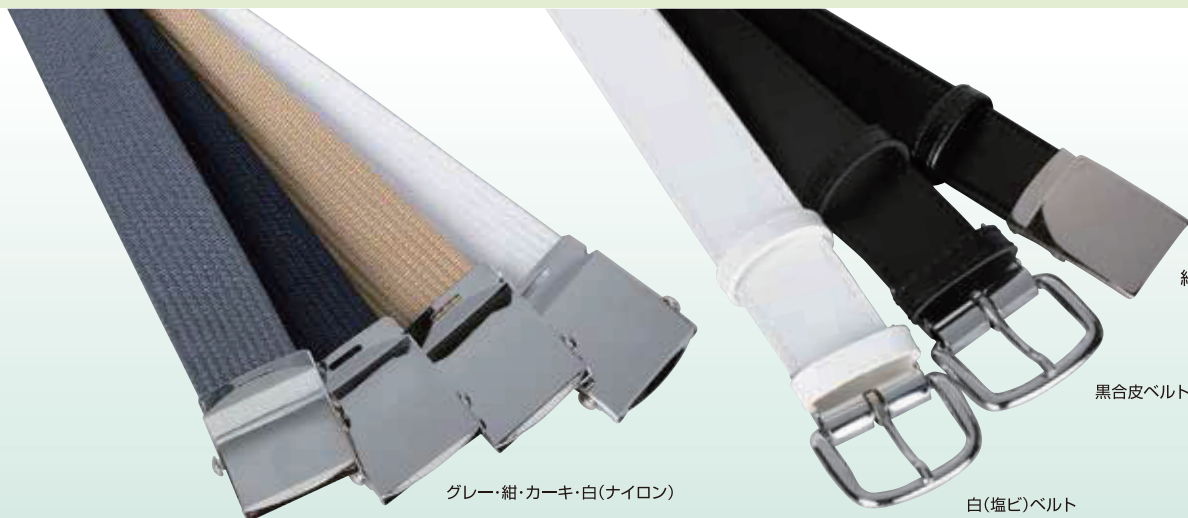
グレー・紺・カーキ・白(ナイロン)