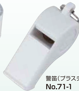
警笛(プラスチック) No.71-1