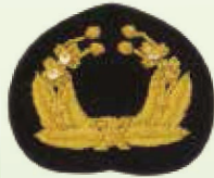
金モール3枚葉 (黒) No.81-2