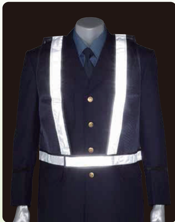
※再帰反射型ですので、 光に当たると反射します。