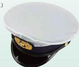
雨覆(乳白色ビニール) No.51-2