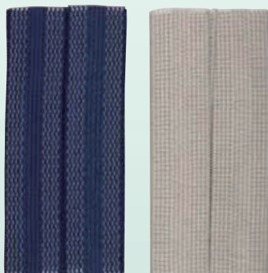
No.103 すそ上げテープ 紺・グレー