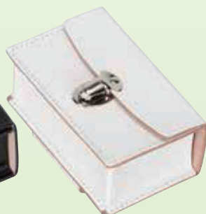
No.79-1 No.79-2 小物入れ(小)