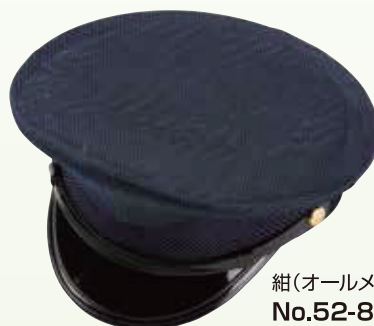
紺(オールメッシュ) No.52-8