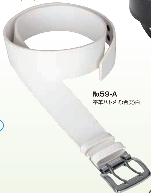
No.59-A 帯革ハトメ式(合皮)白