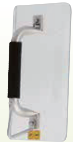
No.131 気丈盾 サイズ 縦 300mm 横 210mm 厚 4mm