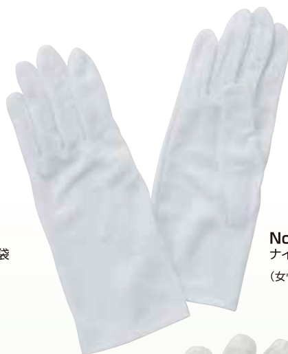
No.72-2 ナイロン手袋 (女性用)